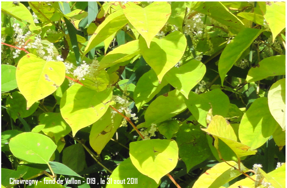
Chevregny - fond de Vallon - D19 , le 31 aout 2011